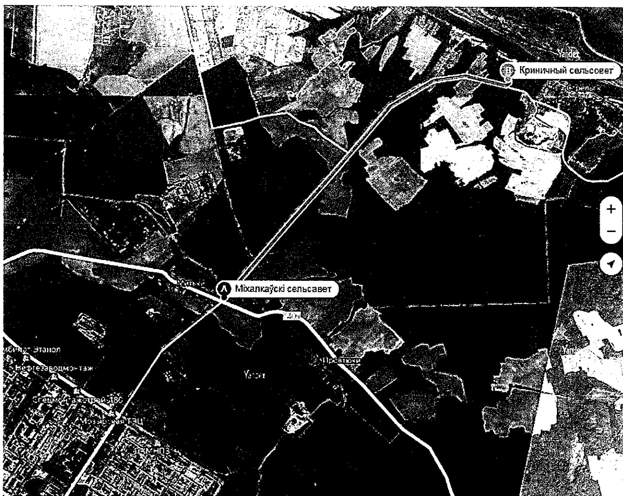
Маршрут Пробега – дистанция от точки А до точки В